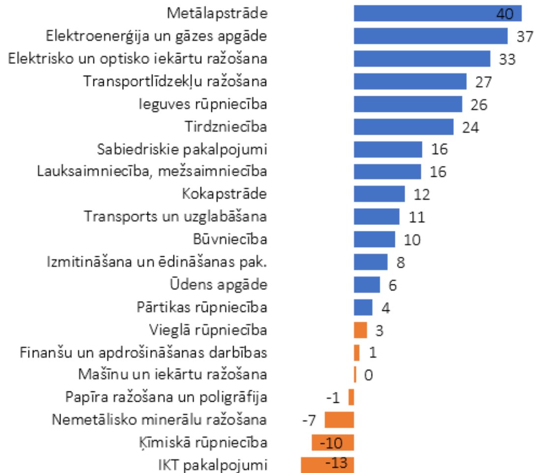
Produktivitāte 2018.g./2013.g., %